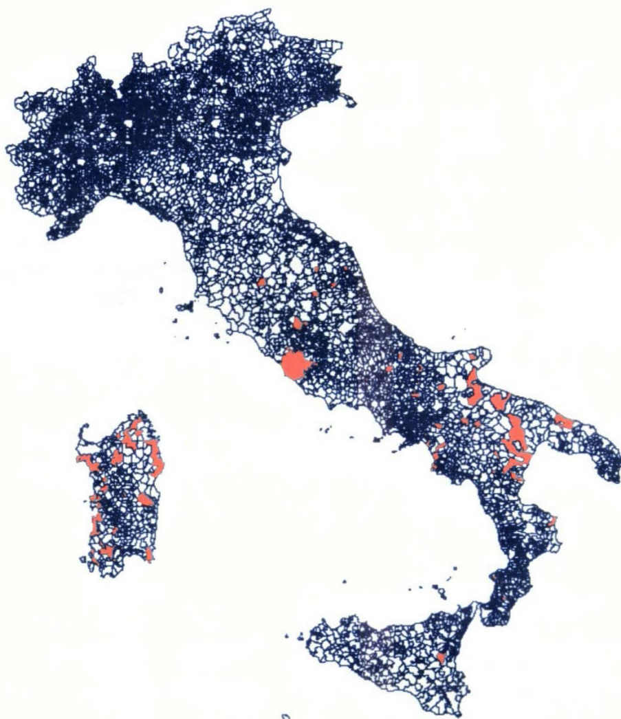
Figura 3: Distribuzione del BTV2 nel periodo 01/10/2003 – 31/12/2003

Il sierotipo 2 ( BTV2 ) è stato rilevato ( Figura 3 ) nelle regioni: Toscana, Umbria, Marche, Lazio, Abruzzo, Molise, Campania, Puglia, Basilicata, Calabria, Sicilia e Sardegna; mentre la circolazione del sierotipo 9 ( BTV9 ) è stata evidenziata nelle regioni Marche, Abruzzo, Molise, Campania, Basilicata, Puglia e Sicilia ( Figura 4 ).